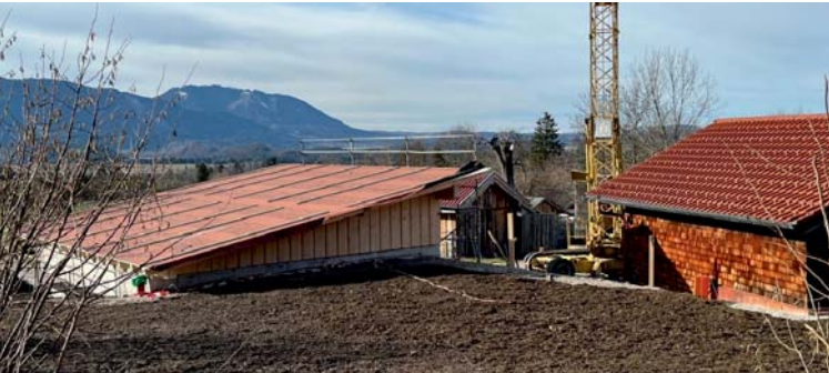
Leistung: 17,775 kWh (Eigenverbrauch)

Darüber hinaus verfügt die Gemeinde seit dem Jahr 2011 über zwei weitere Anlagen: