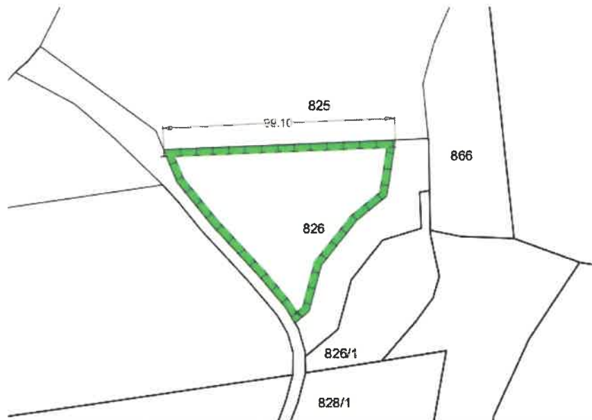
Lageplan Ausgleichsfläche FI.Nr. 826, Gemarkung Großweil, vom 08.08.2024